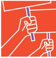
Quyền con người

Mục đích của thẩm định là giải quyết các tác động bất lợi liên quan đến những vấn đề nêu tại các chương sau trong Bộ Hướng dẫn của OECD dành cho các doanh nghiệp đa quốc gia