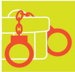
Chống hối lộ, vòi vĩnh và tổng tiền