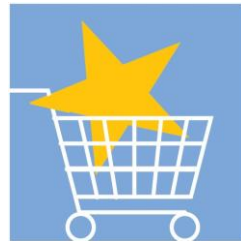
Quyền lợi của người tiêu dùng