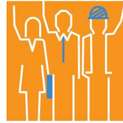
Việc làm và quan hệ lao động