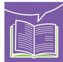
Công bố thông tin

Mục tiêu mà Bộ Hướng dẫn của OECD đặt ra là đảm bảo môi trường đầu tư quốc tế cởi mở và minh bạch, khuyến khích sự đóng góp tích cực của các doanh nghiệp đa quốc gia vào quá trình phát triển kinh tế xã hội. Đây là tập hợp các khuyến nghị toàn diện nhất được chính phủ hỗ trợ về những khía cạnh tạo nên hành vi kinh doanh có trách nhiệm. Các quốc gia tuân thủ Bộ Hướng dẫn OECD này là đại diện của một số nền kinh tế hàng đầu thế giới. Chính phủ các nước này khuyến nghị, các doanh nghiệp hoạt động trên lãnh thổ của họ cũng như đến từ lãnh thổ của họ sẽ tuân thủ các nguyên tắc và tiêu chuẩn được quy định trong Bộ Hướng dẫn của OECD.