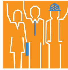
การทำงานและ อุตสาหกรรมสัมพันธ์