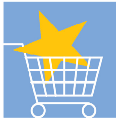
ผลประโยชน์ของ ผู้บริโภค