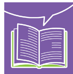
การเปิดเผยข้อมูล

แนวทาง OECD มีจุดมุ่งหมายเพื่อสร้างความมั่นใจในสภาพแวดล้อมการลงทุนระหว่างประเทศที่เปิดกว้างและโปร่งใส รวมทั้งส่งเสริมการมีส่วนร่วมในเชิงบวกของบรรษัทข้ามชาติเพื่อความก้าวหน้าทางเศรษฐกิจและสังคม แนวทางชุดนี้เป็นคำแนะนำที่ครอบคลุมที่สุดที่มีมาจากรัฐบาลเกี่ยวกับเรื่องการค้าการลงทุนที่รับผิดชอบ รัฐบาลที่ยึดมั่นในแนวทางของ OECD เป็นผู้แทนเศรษฐกิจชั้นนำของโลก บางรายได้แนะนำว่าบริษัทที่ดำเนินการในหรือจากเขตแดนของตนควรพิจารณาถึงหลักการและมาตรฐานที่กำหนดไว้ในแนวทางของ OECD