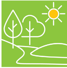
สิ่งแวดล้อม