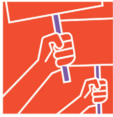
สิทธิมนุษยชน