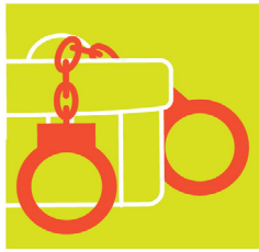
การต่อต้านการติดสินบน การชักชวนและการข่มขู่ ให้รับสินบน